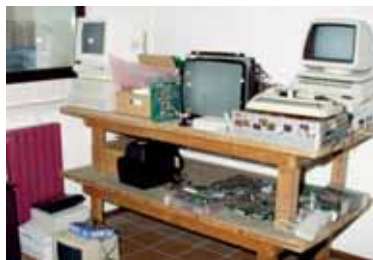
Alcune immagini delle precedenti edizioni di Vicenza Retrocomputing

Il sito ufficiale di Vicenza Retrocomputing è: http://retrocomputing.c3po.it/